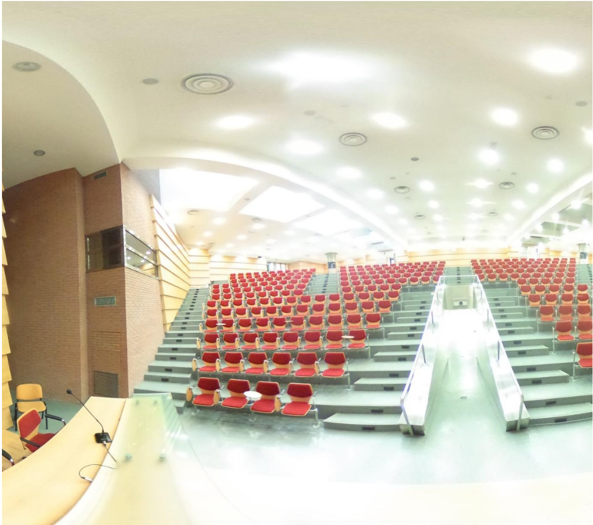
La location Università della Basilicata – Aula Magna del Campus di Macchia Romana